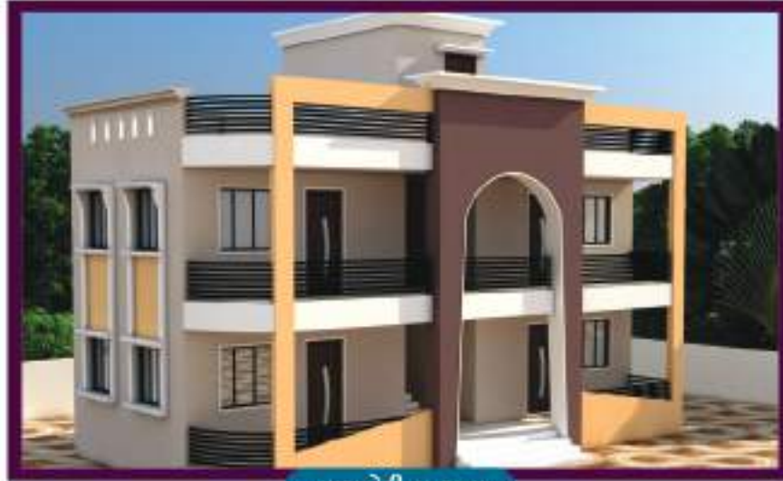
: લાયબેરીના દાતા :